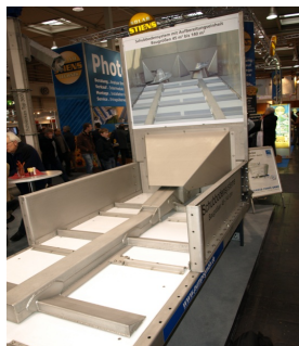
Foto 1: Doseringscontainer med sider og medbringere af rustfrit stål

Endelig varierer de også i oprivnings- og tømteknik, hvor det typiske dog er pigvalser til at oprive materialet og snegle til at bringe materialet ind i biogasreaktoren. Et system bruger i stedet gummi-transportbånd.