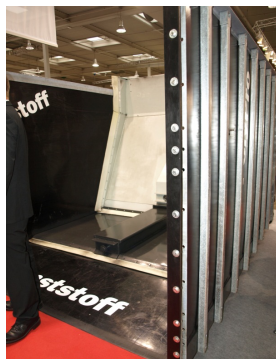
Foto 2 Doseringscontainer i kunststof og bevægelig bagplade

Flere systemer bruger også store beholdere som overdimensionerede foderblandere til at sammenblende og opblende den faste biomasse med cirkulerende reaktorvæske.